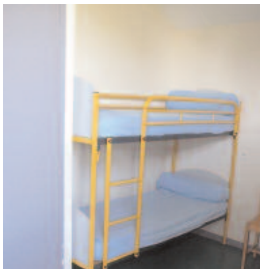
Chambre lits superposés