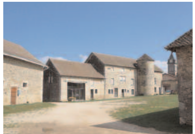
Cour de la ferme