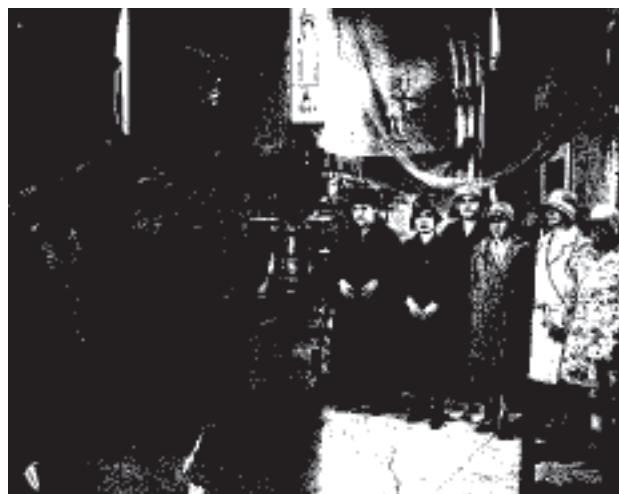
Baptême de la cloche de notre église