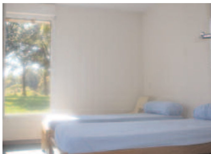
Chambre lits juxtaposés