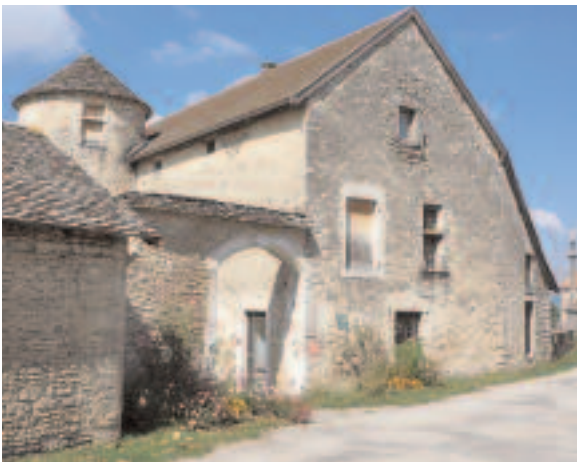
Porche de la ferme