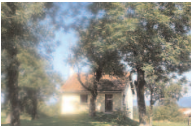
Sanitaires collectifs et bâtiment buanderie