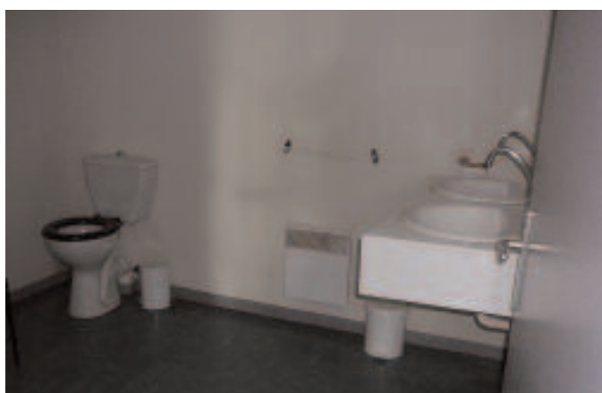
Sanitaires individuels (gîte réservé aux handicapés)