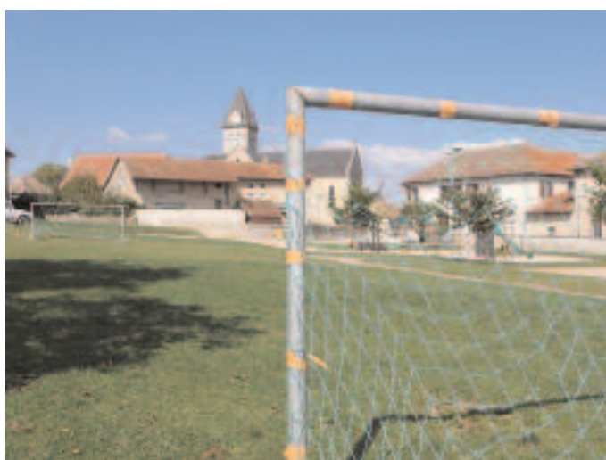
Foot de St Baudille