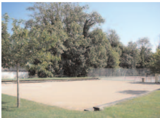
Pétanque de St Baudille