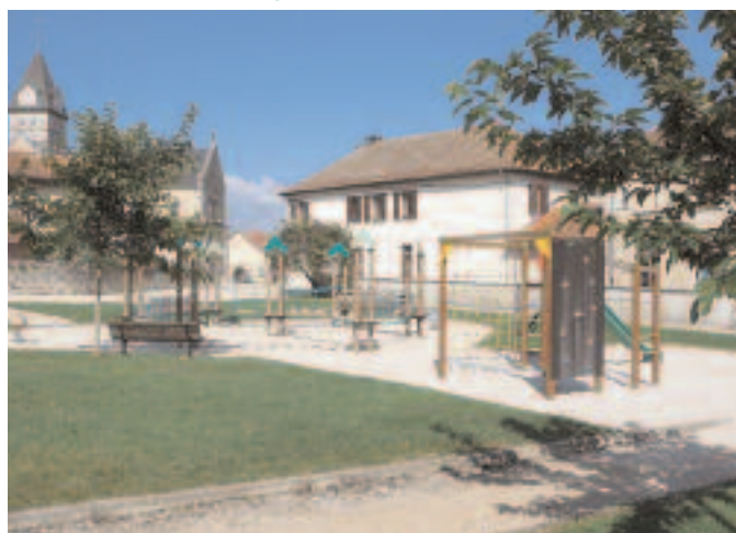
Jeux pour enfants de St Baudille