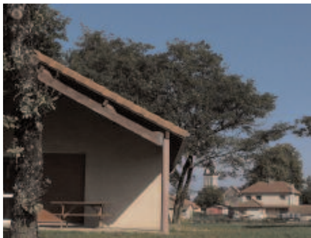
Entrée du gîte n°6