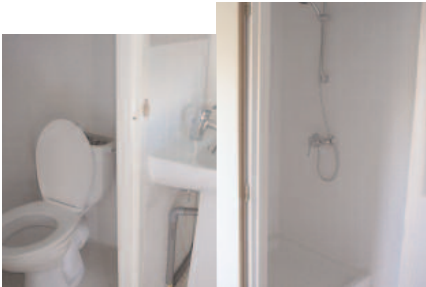
Sanitaires et douches (cuisine)