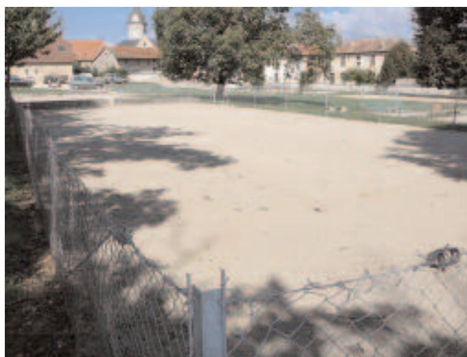
Boules Lyonnaises de St Baudille