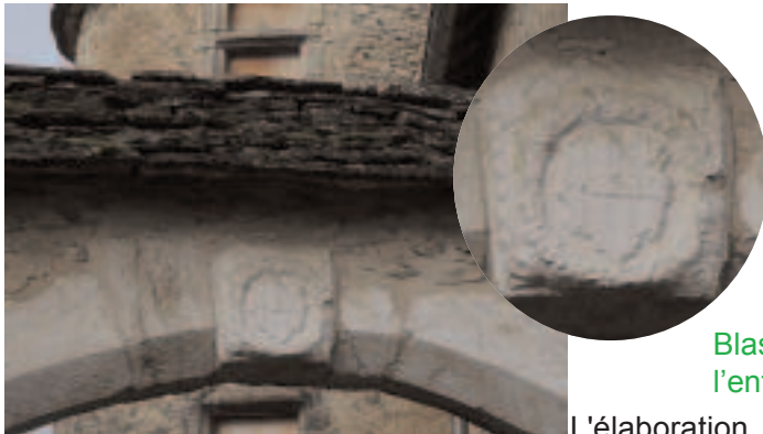
Blason de la famille De Putrain (porche de l'entrée du bâtiment)