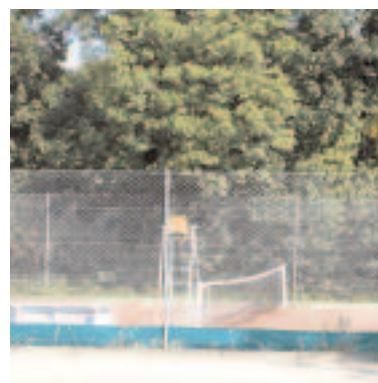
Tennis de St Baudille