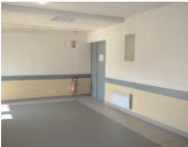
Salle n°2 surface : 40 m2