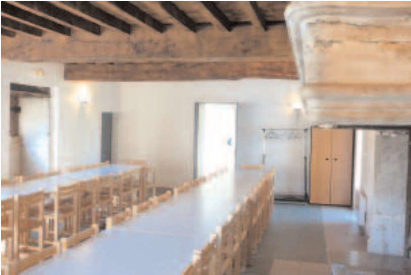
Salle n°1 capacité : 60 personnes surface : 45 m2