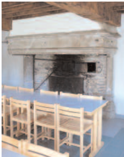
Vieille cheminée XV° siècle