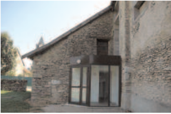
Entrée côté sas